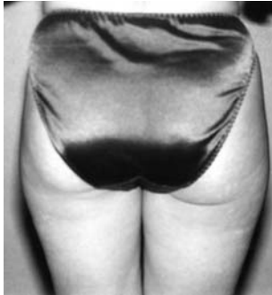
2 meses después con el tratamiento